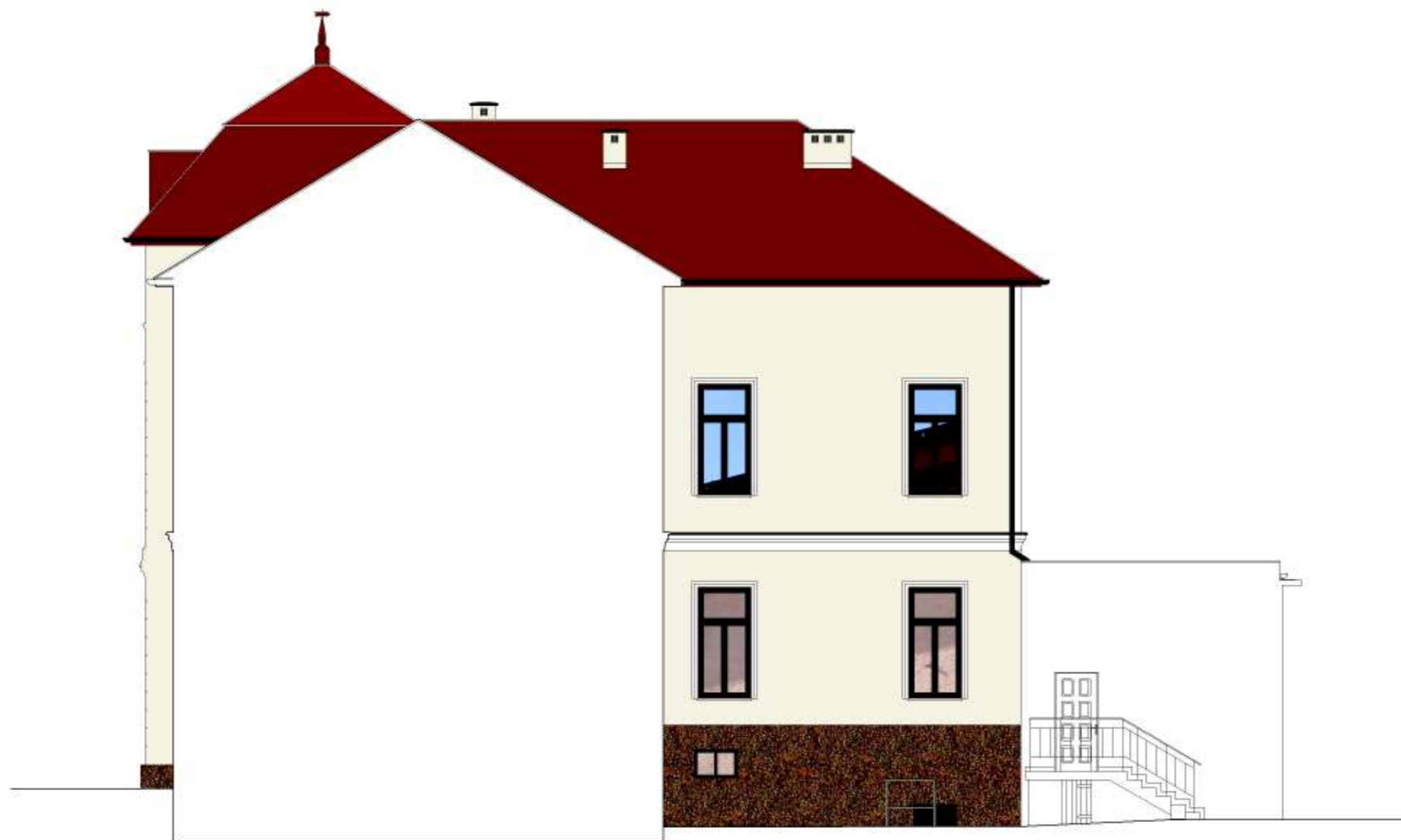
ELEWACJA ZACHODNIA (DZIEDZINIEC)